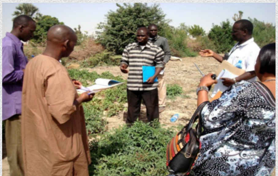
Photo 2: sortie pédagogique au cours d'une formation des acteurs sur le DPI dans le cadre d'un backstopping

«Ledit modèle contribue à la réduction du coût des activités du projet. Il permet d'atteindre un niveau qu'on ne pourra jamais atteindre seul. Il permet à chaque membre de l'équipe technique d'être au même niveau d'information par rapport au projet. Le fait qu'il y a 2 membres par structure permet une certaine disponibilité des uns et des autres sans affecter le projet ».