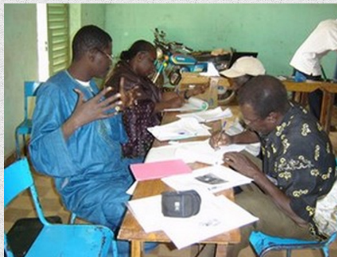
Photo 1: Formation des agents investigateurs sur le DPI, Ségou février 2007

Ce document a pour objet de capitaliser l'expérience de PROFEIS-Mali en matière de construction du partenariat multi-acteurs et de la gouvernance du processus DPI. Il portera sur le contexte, la présentation de l'expérience, les résultats obtenus, les facteurs de reproductibilité et de durabilité, et les principales leçons et recommandations.